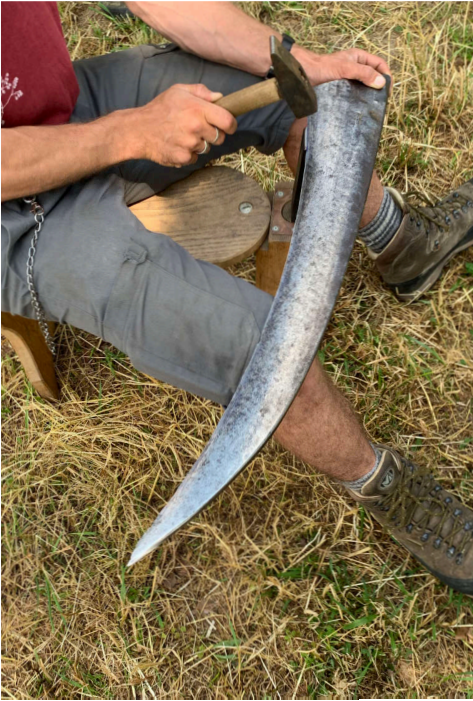
Bearbeitung einer Sense.

Blatt, Steinspitz, Worb, Wetzsteinfass, Bart, Feuertanz, Hamme – dies sind nur einige wenige Begriffe in Zusammenhang mit der Sense oder «Sägisse», welche wir am Sensekurs zu hören bekamen. Lukas und Simon, Kursleiter der Stiftung Wirtschaft und Ökologie SWO, nahmen an diesem heissen Samstag im Juni 16 Teilnehmende der Vereine Zuger Vogelschutz und Pro Natura Zug mit auf eine Reise in die Vergangenheit und die Zukunft rund um die Sense.