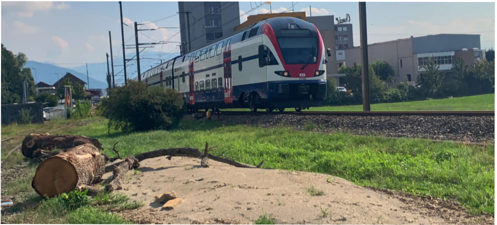
Eine erste Massnahme besonders für Wildbienen und Reptilien.