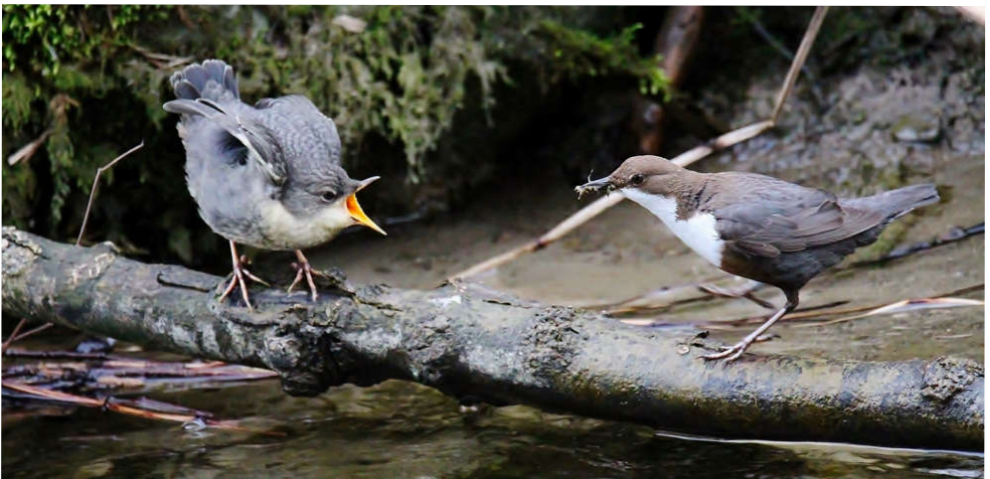
An der Lorze füttert eine Wasseramsel ihr Junges.

Anschreiben von Liegenschaftsverwaltungen und Unternehmen im einzelnen konkreten Fall und am Ball bleiben.