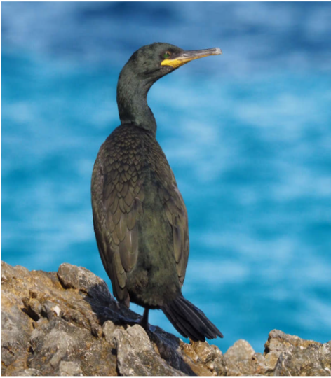
Eine Krähenscharbe.

Dieses Jahr hatte ich grosses Glück mit meinen Ferien: ein wunderbarer Ort, aufgestellte Begleitung, passendes Wetter – und einen Haufen gefiederter Luftbusse, schwimmende Federbündel und auch stoischer Federstatuen gab es zu beobachten. Mit den «treuen Begleitern» im Titel meine ich also nicht die tolle Familie meiner Schwester, mit der ich unterwegs war, sondern die bekannten und fremden Vögel, die ein Stück nordwestlich der Schweiz fliegen, schwimmen und tauchen. Wenig bevölkert, hügelig, von Landwirtschaft geprägt, aber nie langweilig, da mosaikartig mit zahlreichen Wäldchen und von unzähligen Hecken durchzogen und mit einer traumhaft schönen Küstenlinie abgerundet. So erfuhr und erwanderte ich die Bretagne.