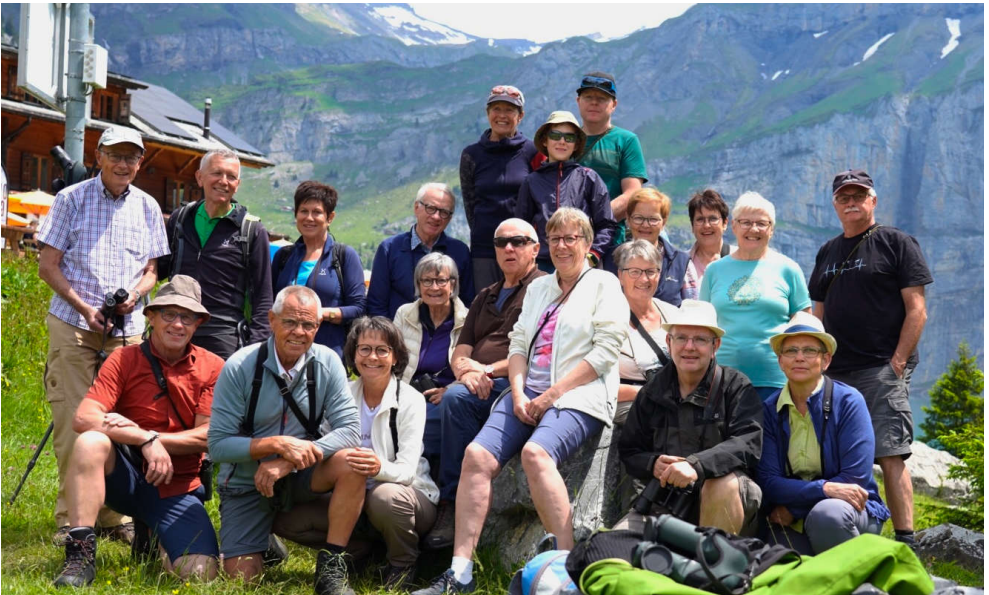
Gruppenbild mit Bergpanorama nahe dem Arvenseeli.

Das nächste Bergvogelweekend wird vom 14. bis 16. Juni 2024 stattfinden.