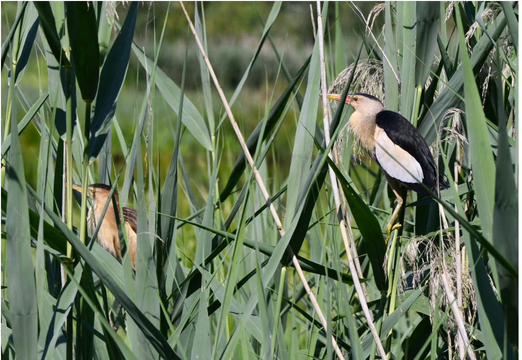
Leserbild: Zwergdommeln - Bewohner der Feuchtgebiete.

Wie jedes Jahr führen wir unseren beliebten Fotowettbewerb durch. Haben Sie besondere Bilder von Vogelarten in Feuchtgebieten? Dann senden Sie diese gerne bis spätestens am 16. Oktober 2023 an Urs Felix - felix.urs@bluewin.ch .