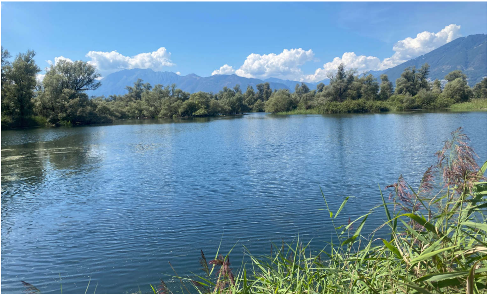
Beim Bird Race im Tessin zählte unser Zuger Team «Aaahh...!!Zugvögel» 102 Vogelarten.

Team «Aaahh...!!Zugvögel» vom Zuger Vogelschutz und Vogelschutzverein Wasserramsel Innerschwyz