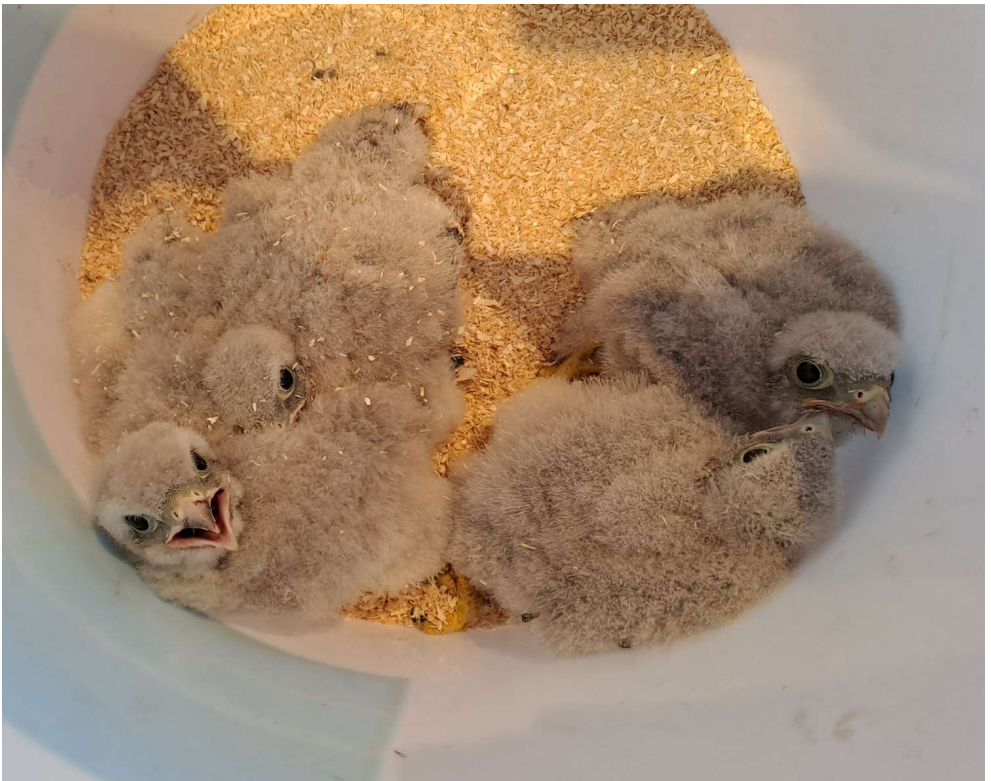
Die jungen Turmfalaken am Tag der Beringung.