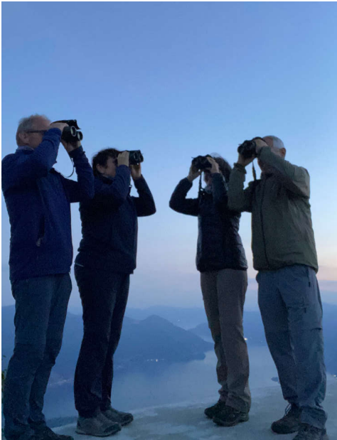
Das Team «Aaahh...!!Zugvögel».

Mit dem Einläuten des Monats September erwacht auch das Bird Race Fieber. Dieses Jahr traten wir die Reise in den Süden an. Unser Zug überquerte die Göschenen - Wassen Route, so wie es Zugvögel wohl auch machten.