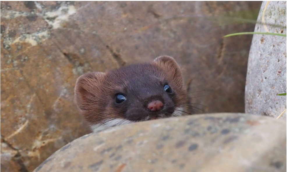
Immer neugierig und verspielt - das Hermelin.