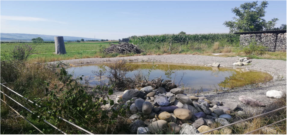
Der Amphibienteich heute - ein gelungener Einsatz für die Natur.