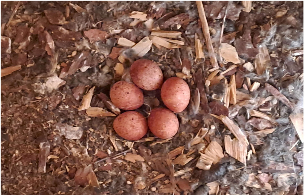
Fünf Turmfalkeneier lagen im Schleiereulenkasten auf dem Hof Talacker/Hünenberg.

Die Beringersaison fängt jeweils früh an, denn es kann sein, dass bereits im Februar oder März die Schleiereulen sich finden und ihr Balz- und Paarungsritual beginnen. So geschah es, dass Mitte Februar auf dem Hof Talacker in Hünenberg ein Schleiereulenpaar bei der Kopulation beobachtet wurde. Wie toll, wir freuten uns riesig, dass im Talacker erneut ein Schleiereulenpaar brütet, nachdem im 2022 vier junge Schleiereulen geboren, aufgezogen und schlussendlich von uns beringt wurden.