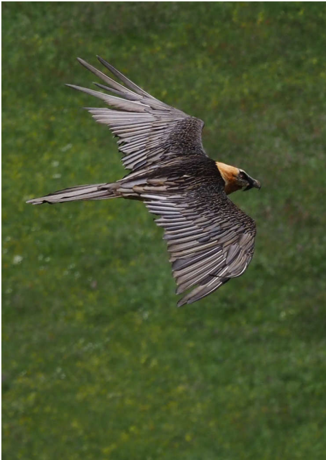
Adulter Bartgeier.