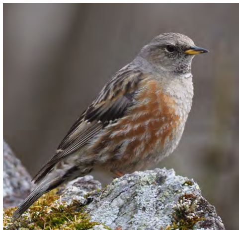
Wurde gesichtet: Die Alpenbraunelle.

Nach dem Morgenessen liess der Regen nach. Wir setzten unsere Tour fort. Weitere stimmfreudige Arten konnten wir in die Liste eintragen. Haubenmeise, Rotkelchen, Tannenmeise, Haus- und Gartenrotschwanz liessen sich durch Feldstecher und Fernrohr bestimmen. Auch Goldhähnchen und Trauerschnäpper zeigten sich. Eine Dreiergruppe Waldbaumläufer kletterte am Baumstamm hinauf.