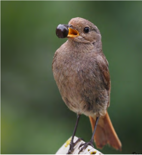
Hausrotschwanz Weibchen.

Unterwegs im Moorgebiet Rothenthurm eines heissen Tages. Abmarsch um 07:00 Uhr, auf zur Feldornithologen-Prüfung! Es ist so ungefähr der heisseste Tag in diesem sehr heissen Juni. Nach dem Moor geht's runter an den Zürichsee nach Pfäffikon, wo wir die Lebensräume See, Siedlung und Wald nach allen möglichen Vogelarten durchforsten und genau hinhören müssen.