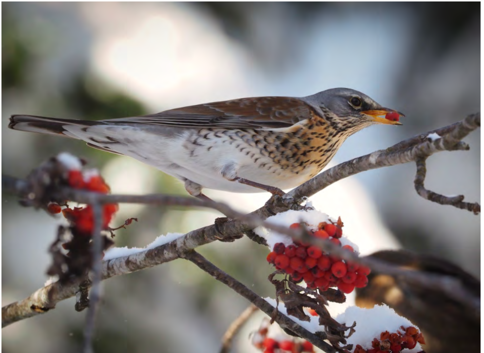
Wacholderdrossel beim winterlichen Snack.