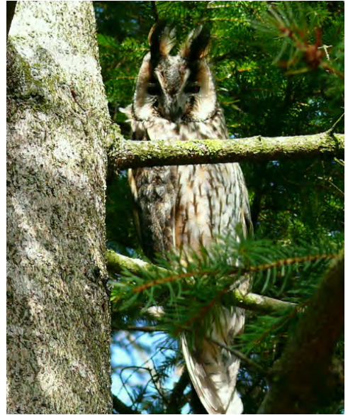
Waldohreulen brauchen störungsarme Gebiete.

Das Hauptanliegen unseres Vereins sind Gebiete, welche durch Menschen nicht gestört werden. Zahlreiche Waldbewohner bei den Tier- und Vogelarten sind ausgesprochen störungsempfindlich und benötigen einen besonderen Schutz. Wo möglich soll auf Verbotstafeln verzichtet werden. Dafür kann es Sinn machen, nicht mehr notwendige Bewirtschaftungswege zurück zu bauen und einzuwachsen zu lassen. Wir Mitglieder vom Vogelschutz, wir Naturliebhaberinnen