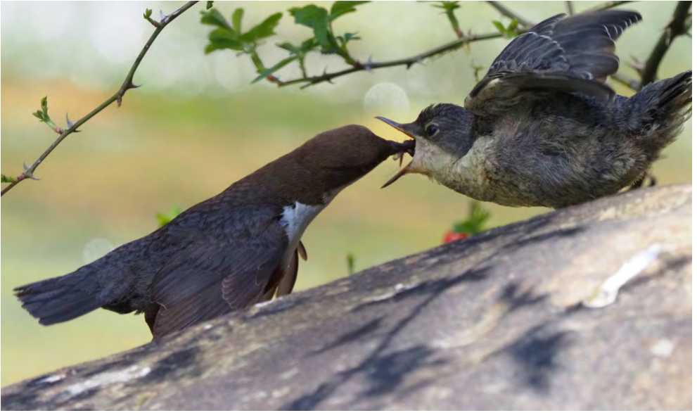
Wasseramsel bei der Fütterung ihres Jungen.