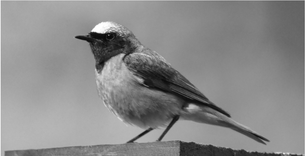
Gartenrotschwanz in Schwarz-Weiss.