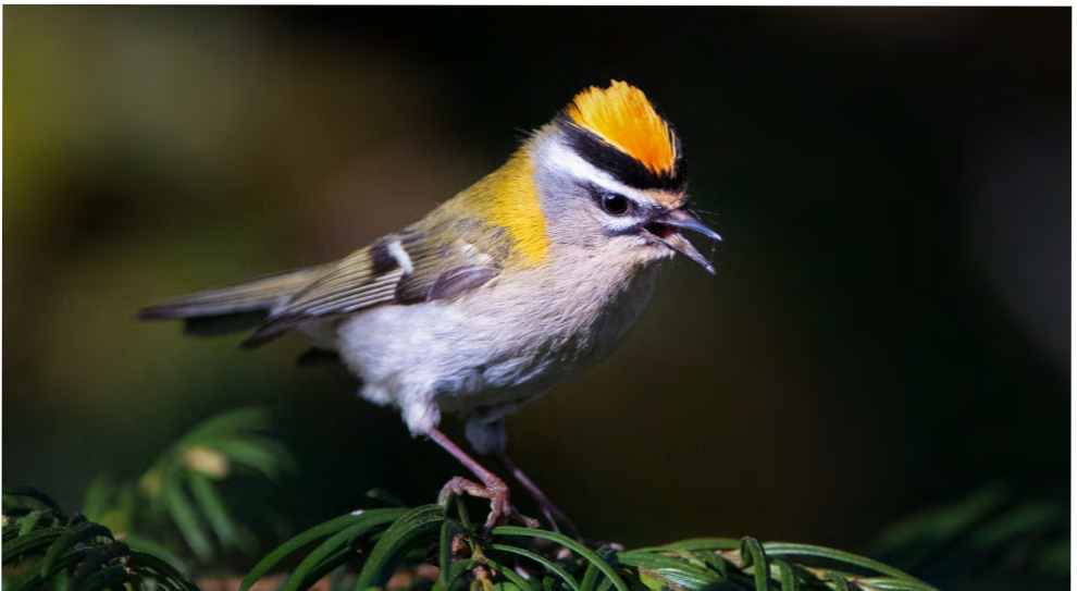
Auch das Sommergoldhähnchen profitiert von mehr Ruhe.

Die Bauindustrie hat Holz als wertvollen Rohstoff (wieder-) entdeckt. Ihre Lösungen sind echt innovativ. Sie brauchen aber viel Bauholz. Landauf landab entstehen klimaneutrale Pellet-Heizungen, welche auf grosse Brennholzmengen angewiesen sind. Bäume, welche als Bauholz ungeeignet sind, lassen sich so sinnvoll verwerten. Kritisch für die Biodiversität ist vor allem der steigende Erholungsdruck, welcher in der Corona-Zeit nochmals zugenommen hat. Bikerinnen und Biker sausen auch über steilste Wege und legen gleich selber teils illegale