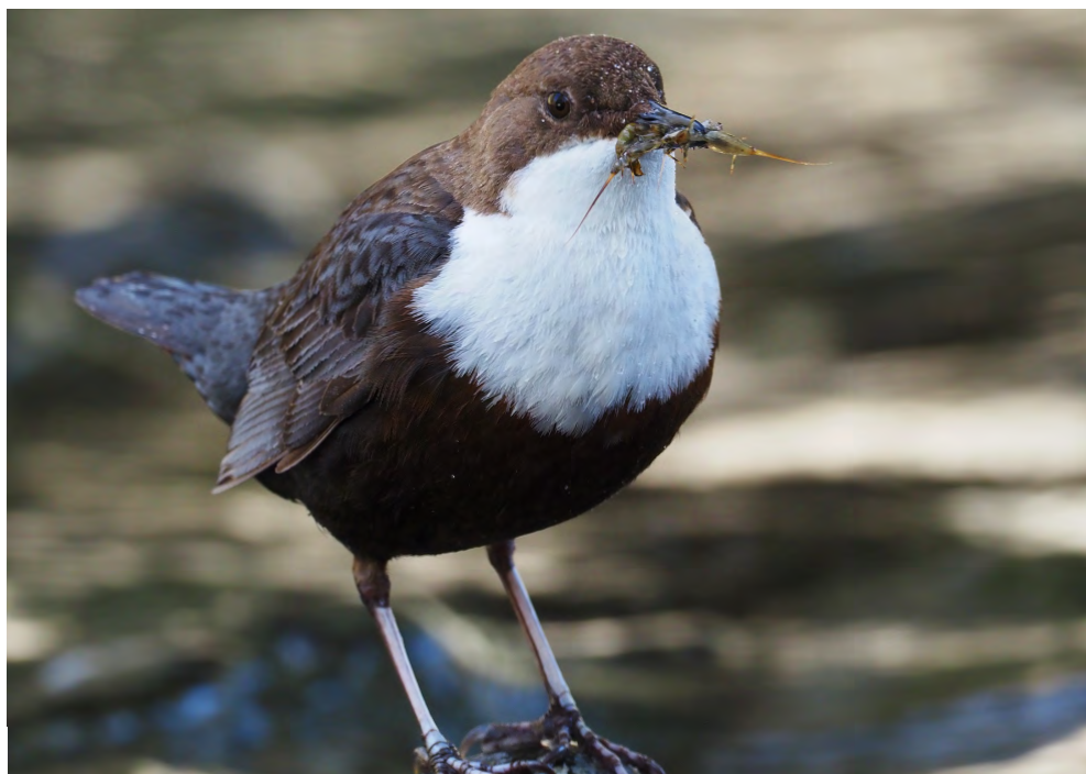
Durch Nisthilfen sollen die Wasseramseln gefördert werden.