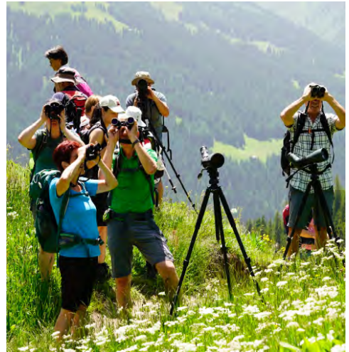
Wo ist der Bartgeier?

Es ist ein sonniger und heisser Sommertag. Nach dem reichhaltigen Frühstück nehmen wir das Postauto hinauf nach Monstein, einem kleinen Dorf unweit des Rinerhorns. Hier treffen wir auf