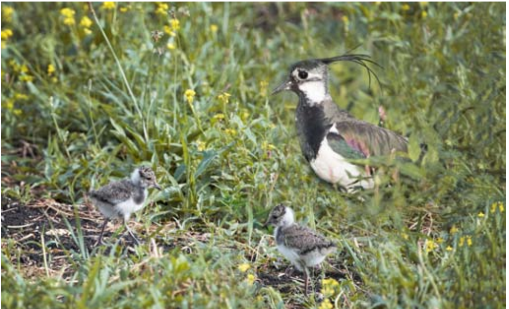
Zwei junge Kiebitze werden vom Altvogel bewacht

Weitere Informationen zum Vogel des Jahres finden Sie auf www.birdlife.ch und www.vogelwarte.ch