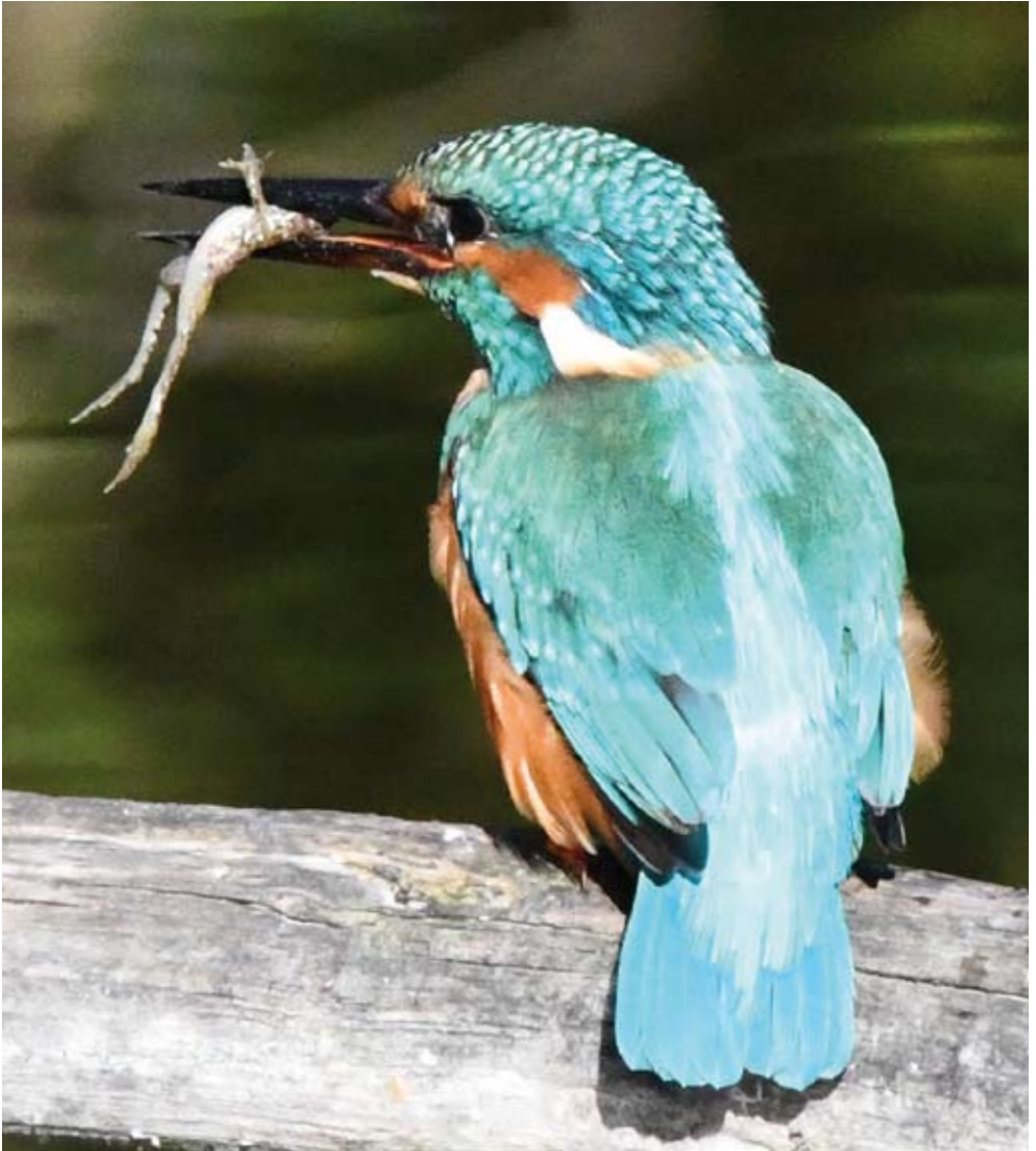
Eisvogel mit Beute