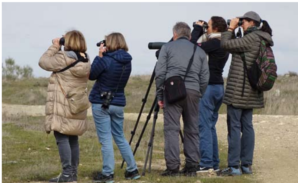
Reisegruppe beim Vogelbeobachten