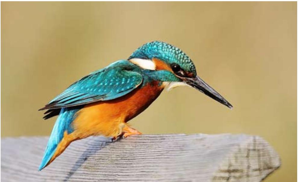
Eisvogel – Gewinner-Foto des Wettbewerbs 2018

Wir wünschen allen Fotografen viel Spass bei der Motivsuche und unvergessliche Momente in der Natur.